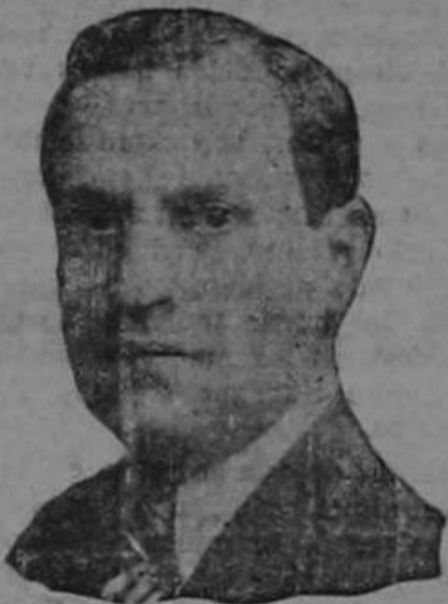
Dr. CALDERON GUARDIA